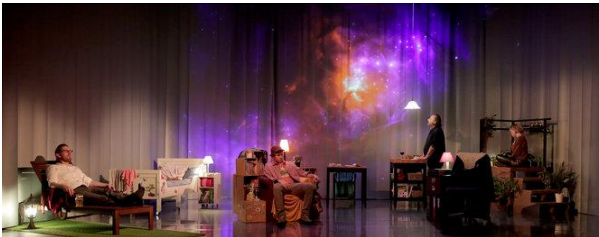
Scène d'Ovni